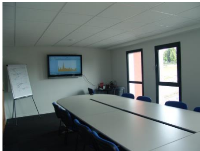
(Salle de Formation)