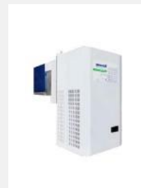
Groupes frigorifiques monoblocs