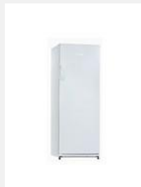
Réfrigérateurs sans congélateur