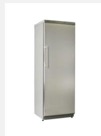
Réfrigérateurs et congélateurs de stockage