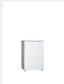
Réfrigérateurs avec congélateur à l'intérieur