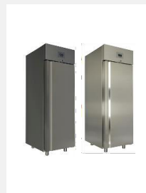
Réfrigérateurs et congélateurs professionnels