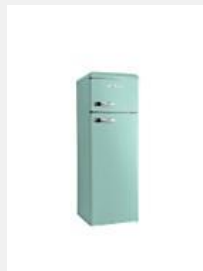
Réfrigérateurs- congélateurs avec congélateur en haut