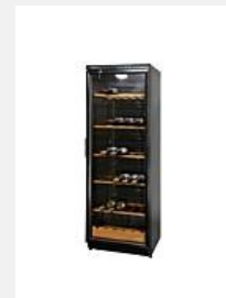
Réfrigérateurs à vin