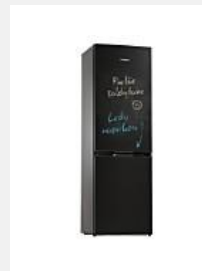
Réfrigérateurs- congélateurs avec congélateur en bas