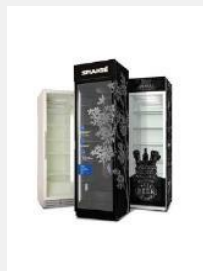
Réfrigérateurs à porte vitrée